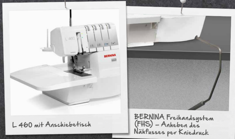
L 460 mit Anschietisch

Der gut ausgeleuchtete, grosse Arbeitsbereich dieser Overlocker erleichtert das Nähen und Einfädeln von Greifer und Nadeln. Dank des Freihandsystems (FHS), über welches der Nähfuss angehoben und gesenkt werden kann, bleiben beide Hände frei für das Nähen und Führen des Stoffs. Der Anschietisch erweitert den Arbeitsbereich und erleichtert das Umsetzen grosser Nähprojekte.